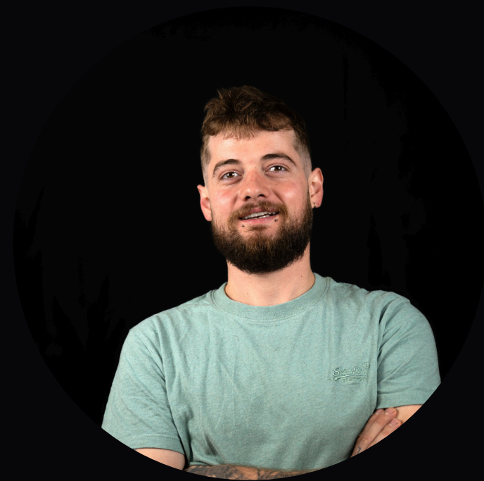
Gailland Jordan LARSEN COLOR FILM

Pour tous vos forfaits avec cadreur supplémentaire ou photographe, LARSEN COLOR FILM travaille avec Nicolas Tissot d'EPEEX STUDIO (photographe-vidéaste-télépilote de drone)