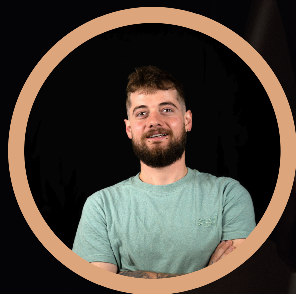
Gaillard Jordan RÉALISATEUR/VIDÉASTE

Je suis passionné avant tout de cinéma depuis mon enfance, mon expérience et mon dynamisme seront à votre service pour réaliser le film de mariage de vos rêves.